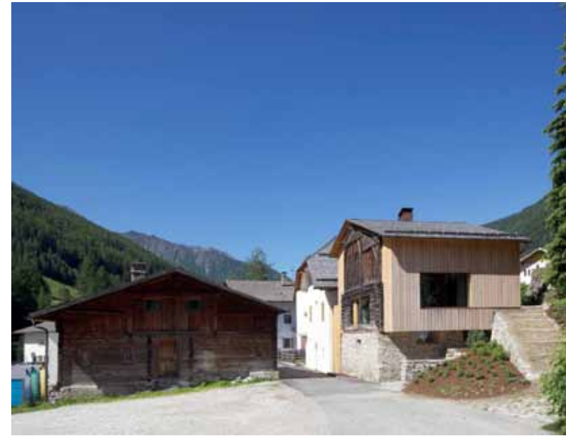
Risanamento della vecchia Canonica, Predoi, EM2 Architekten