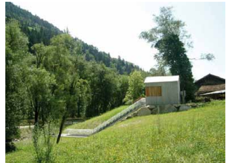
Centrale idroelettrica Weger, St Martin I. P.