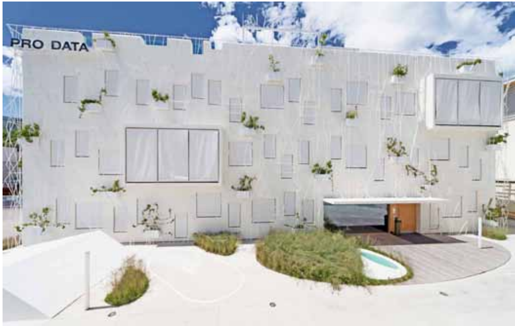
Uffici Asa / Pro Data, Caldaro, Sapinski Salon Flora-Sommer