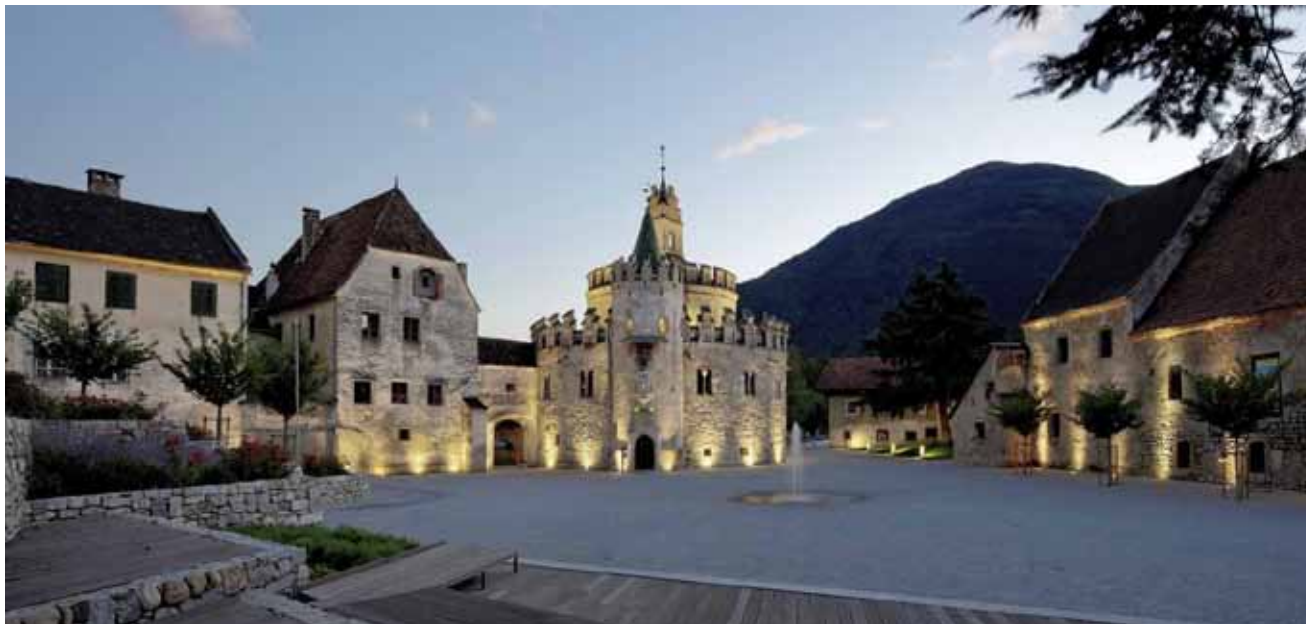
Risistemazione della Piazza dell'Abbazia di Novacella, Varna, Markus Scherer