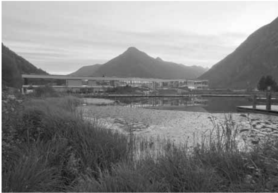
Sport Center & Spa Cascade, Campo Tures, Christoph Mayr Fingerle