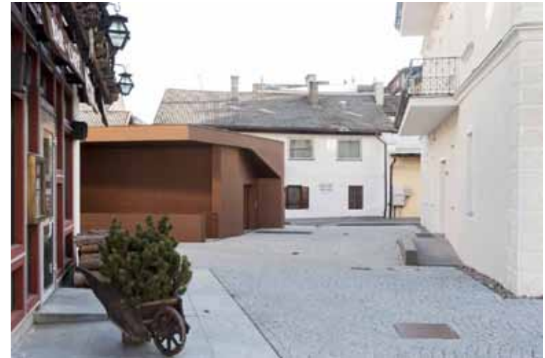
Residenza Pernwerth, San Candido, Christoph Mayr Fingerle