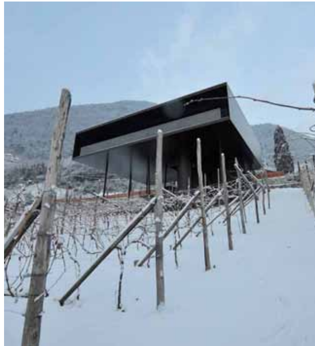
Casa Höller, Lana, Höller & Klotzner Architekten