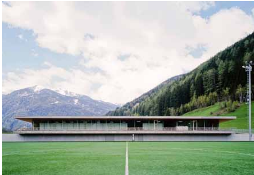
Complesso sportivo di San Martino, Val Aurina, Stifter + Bachmann