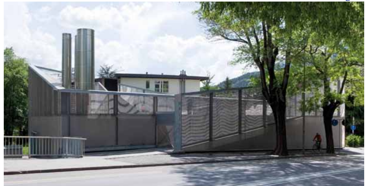
Centrale di teleriscaldamento, Bressanone, Modus Architects Attia-Scagnol