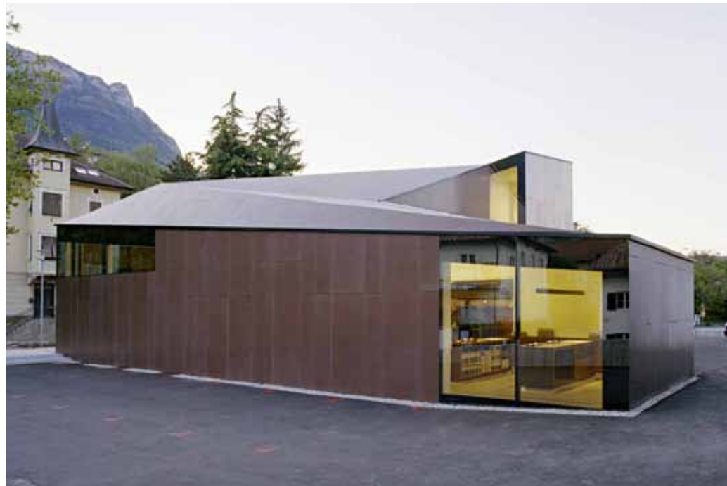
Winecenter, Caldaro, Feld72