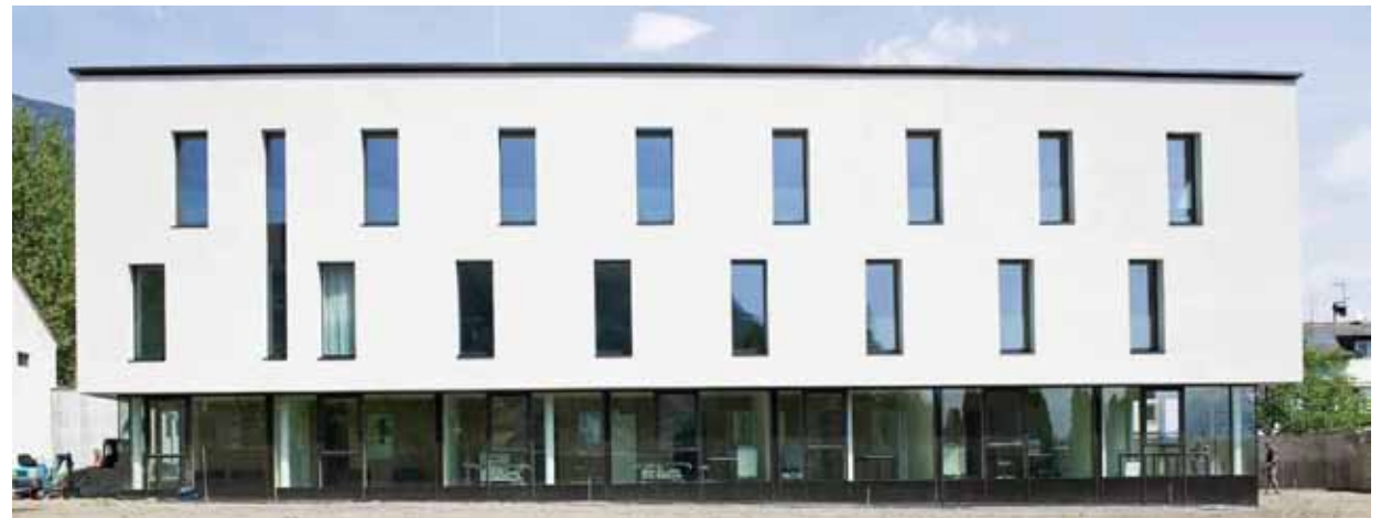
Distretto Sociale e Sanitario di Lana e circondario, Lana, Höller & Klotzner Architekten