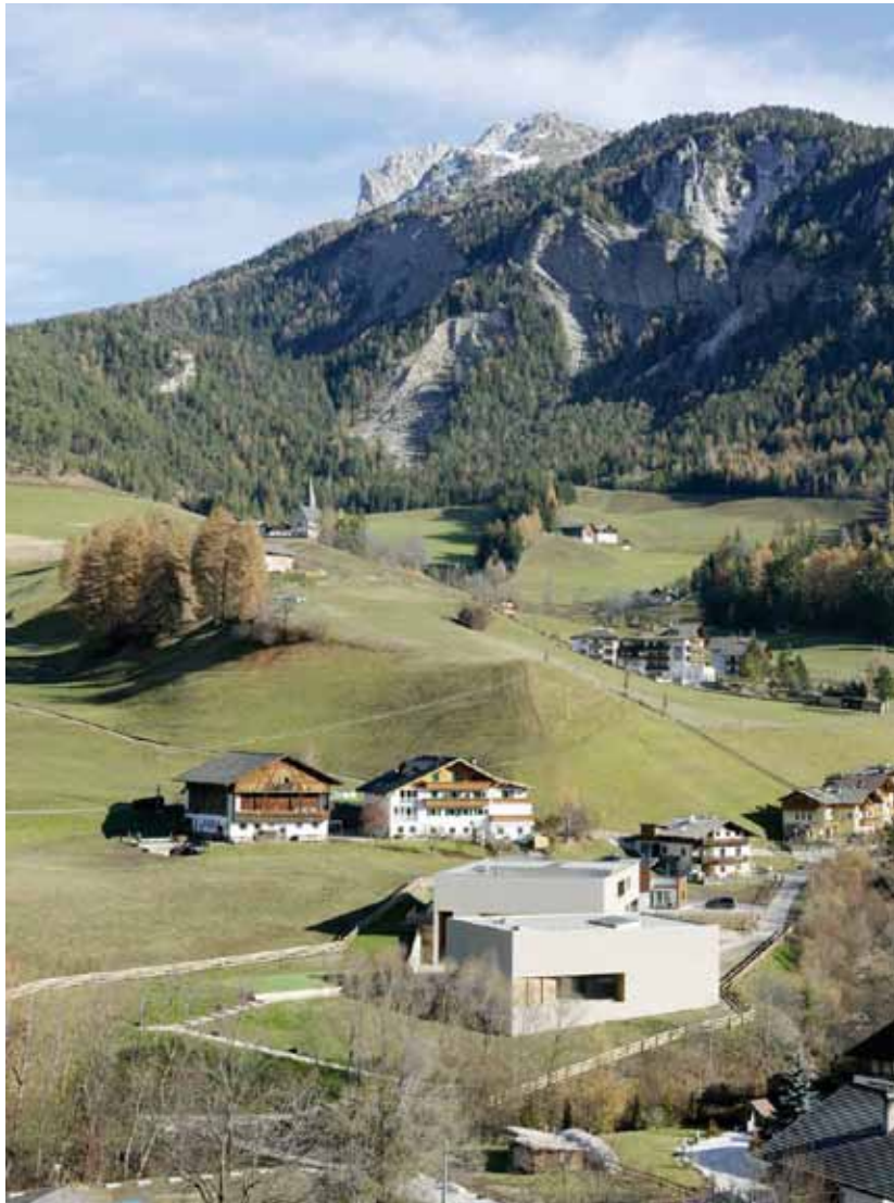
Centro Visite Parco Puez-Odle con Scuola Elementare e Materna di Santa Maddalena, Funes, Burger Rudacs Architekten