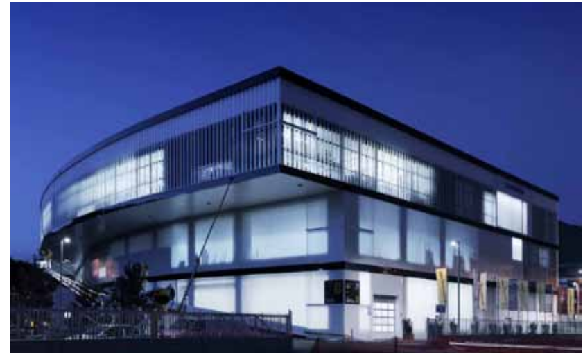
Technoalpin, Bolzano, Johannes Niederstätter, VWN Architects, Roland Baldi