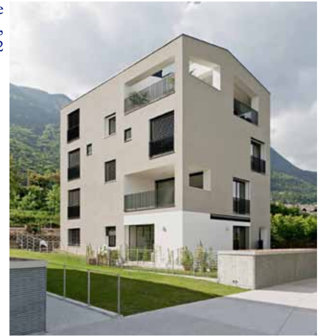
Espansione residenziale Via dei Giardini, Caldaro, Feld72