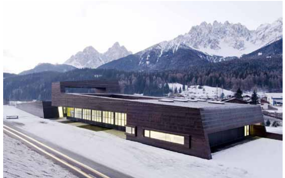
Ziv-Centro della Protezione Civile, San Candido, Alleswirdgut