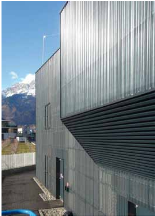
Centrale di teleriscaldamento, Merano, Luca Canali