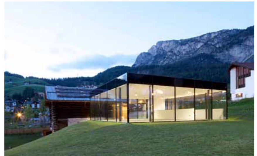
Centro Culturale Tublà Da Nives, Selva Gardena, Rudolf Perathoner