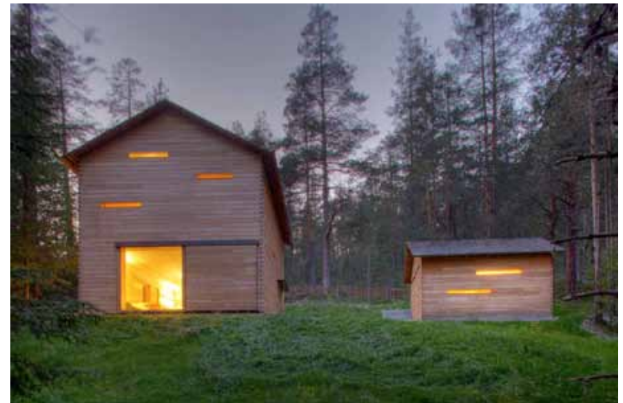
Casa di caccia Tamers, San Vigilio di Marebbe, EM2 Architekten