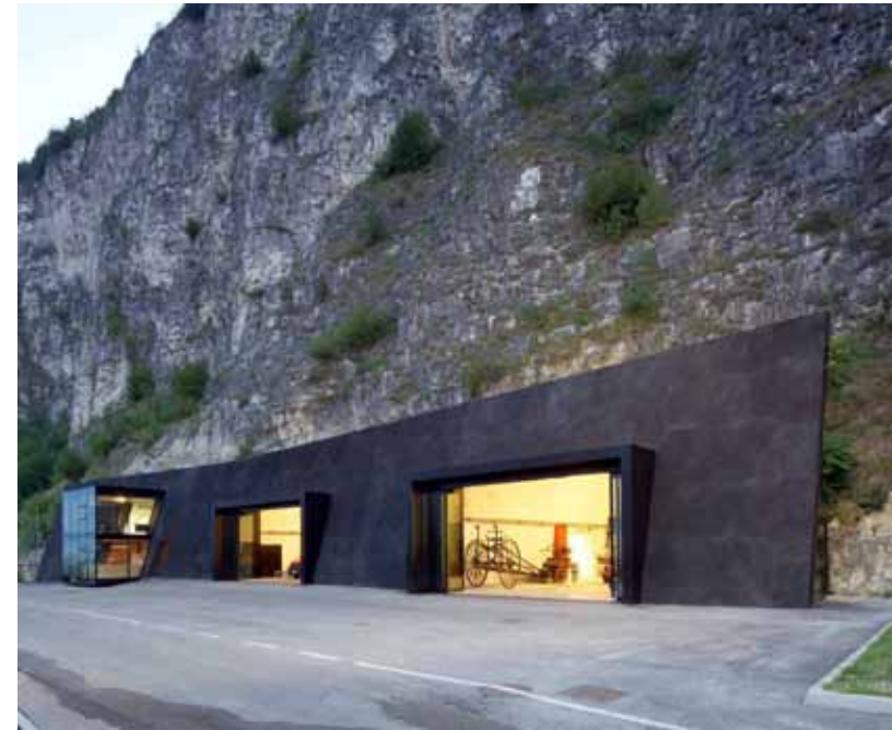
Vigili del Fuoco, Magrè, Bergmeisterwolf Architekten