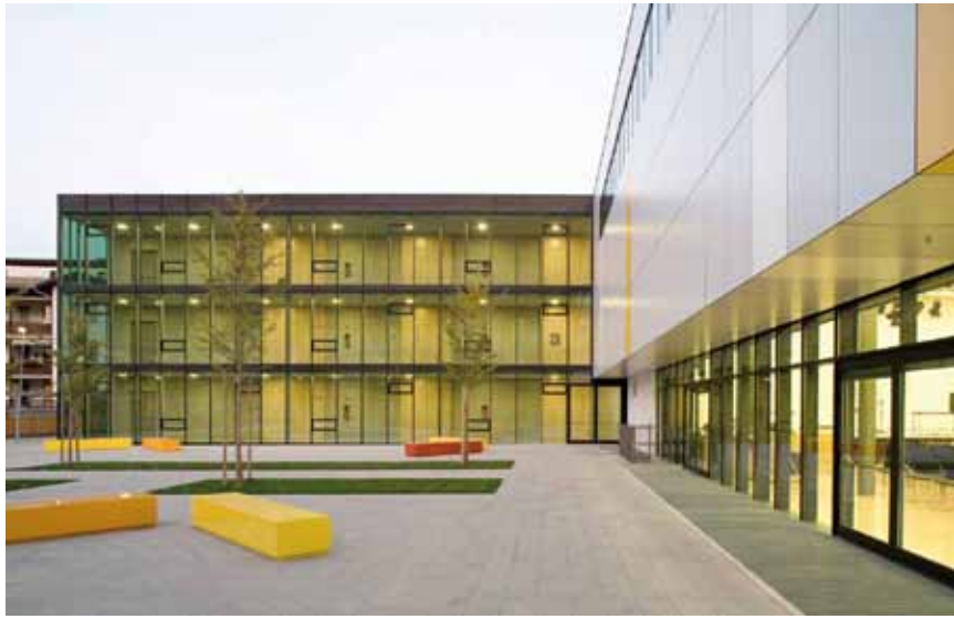
Liceo Pedagogico Josef Gasser e Scuola Materna, Bressanone, Peters & Keller Architekten