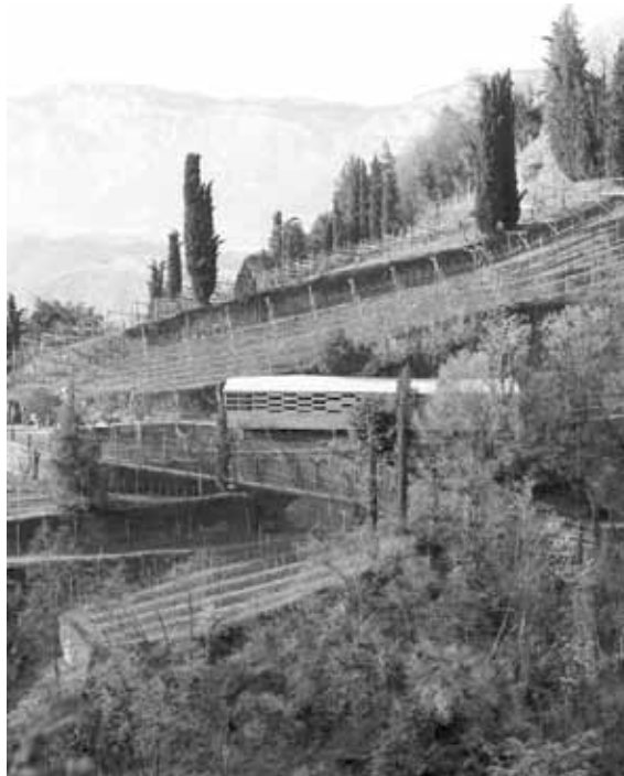
Edificio rurale Egghof, Bolzano, Susanne Waiz