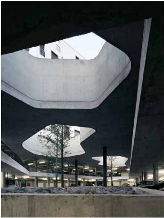
Complesso abitativo EA7 Casanova, Bolzano, Christoph Mayr Fingerle