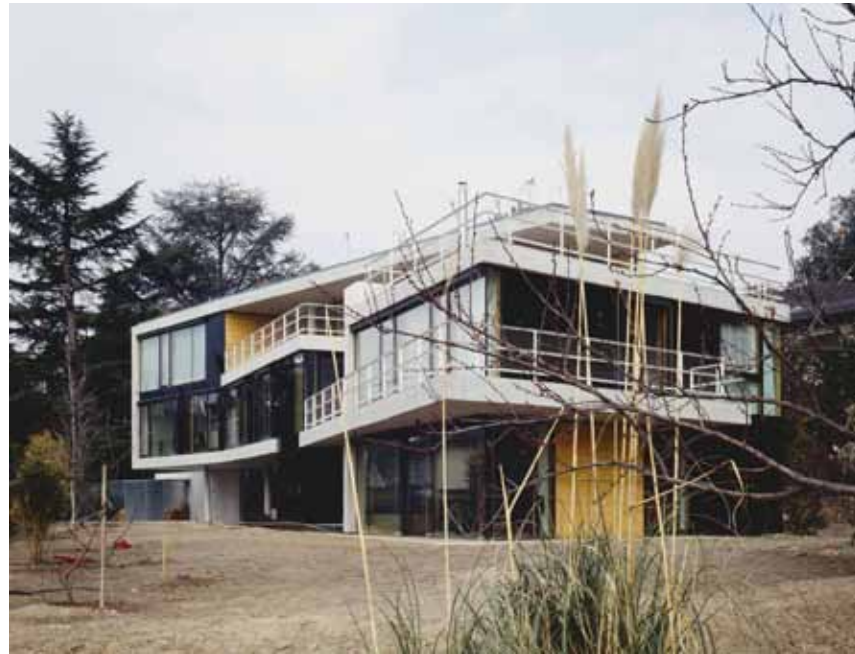
Casa trifamiliare Dubis, Merano, Silvia Boday & Rainer Koberl