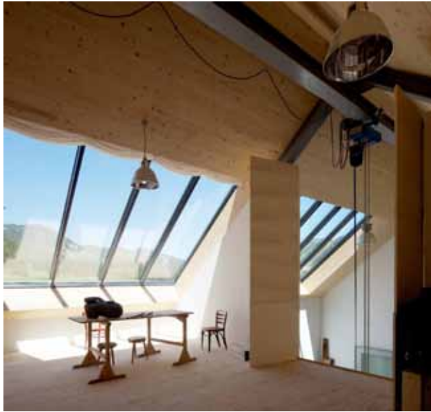
Atelier di Lois Anvidalfarei, Ciaminades in Badia, Siegfried Delueg