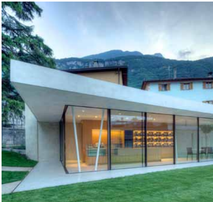
Le Verre Capricieux - Padiglione nel parco, Termeno, David Stuflesser