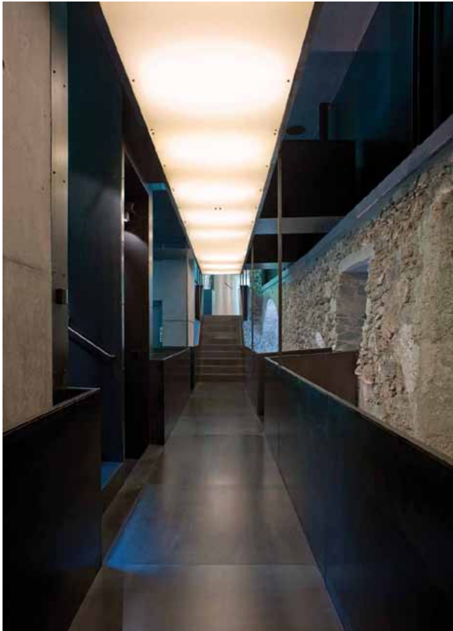
Museo e Foresteria dell'Abbazia di Montemaria, Burgusio, Comune di Malles Werner Tscholl