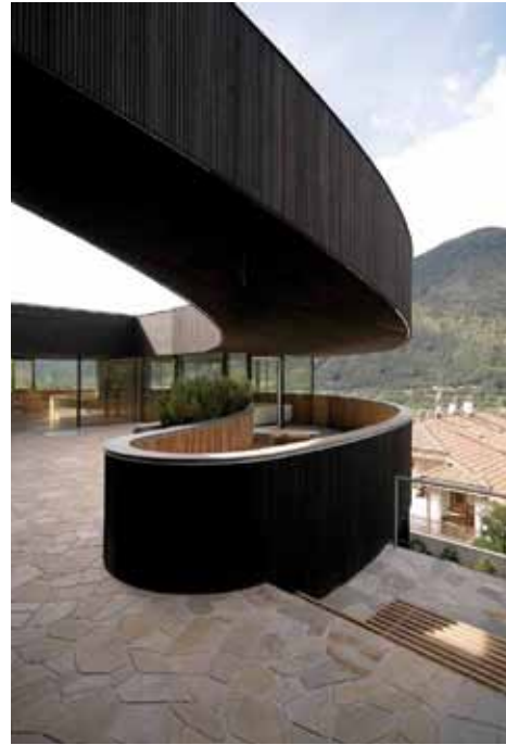
Casa D, Novacella, Comune di Varna, Pauhof Architekten, Manfred Alois Mayr