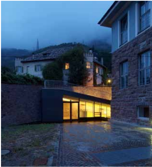
Mensa della scuola Elementare Rosmini a Gries, Bolzano, Pardeller Putzer Scherer