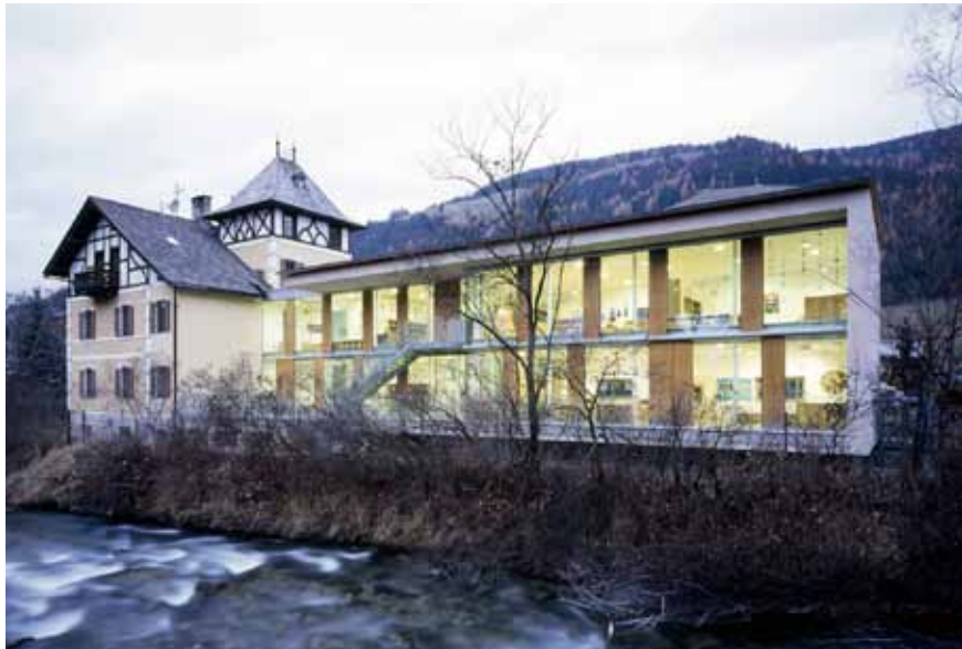
Scuola Materna, Villabassa, Stifter + Bachmann