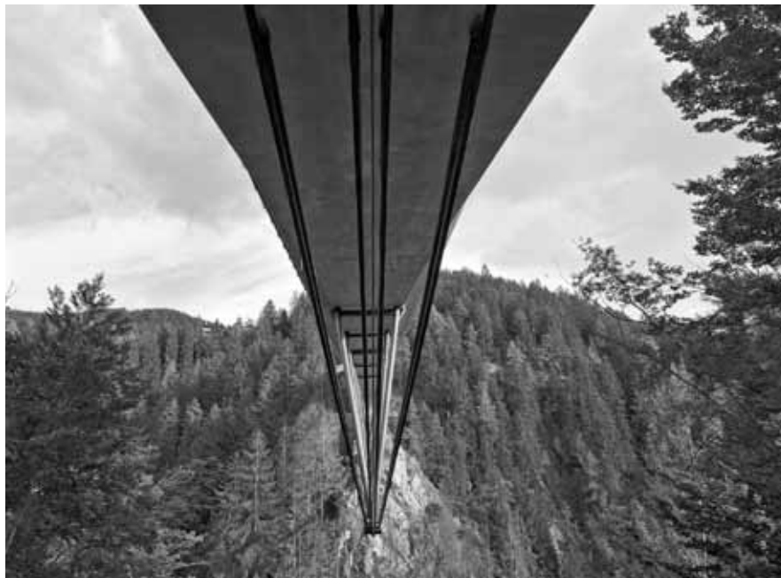
Ponte di Avelengo, Avelengo, Bilfinger Berger Instandsetzung GmbH