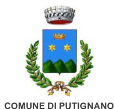
COMUNE DI PUTIGNANO