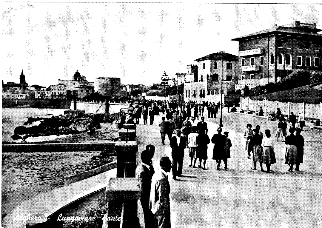
Passeggiata Lungomare Anni '50

Passeggiata Lungomare Anni 2000 e dintorni...?