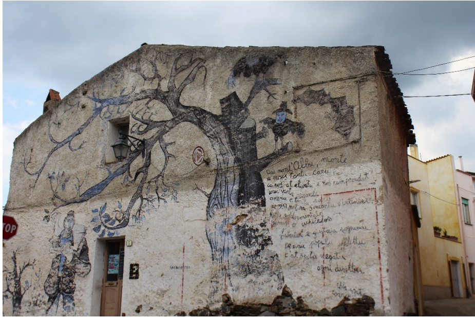
Figura 3 Vista Frontale