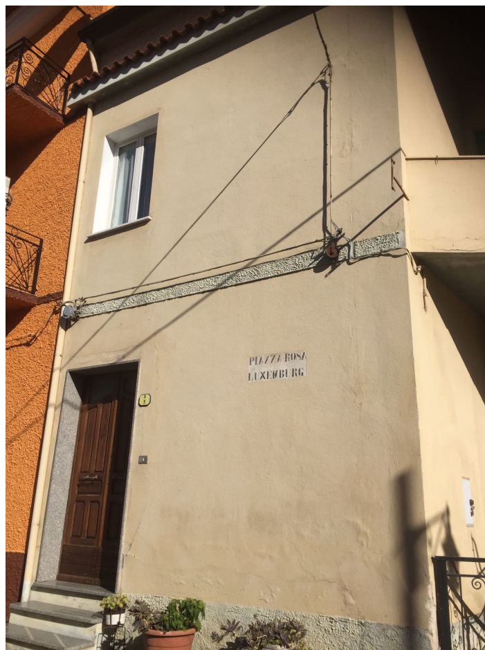
Figura 5 Vista Frontale