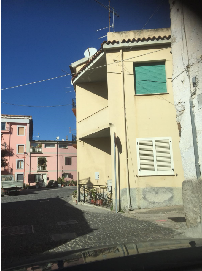
Figura 6 Vista Laterale