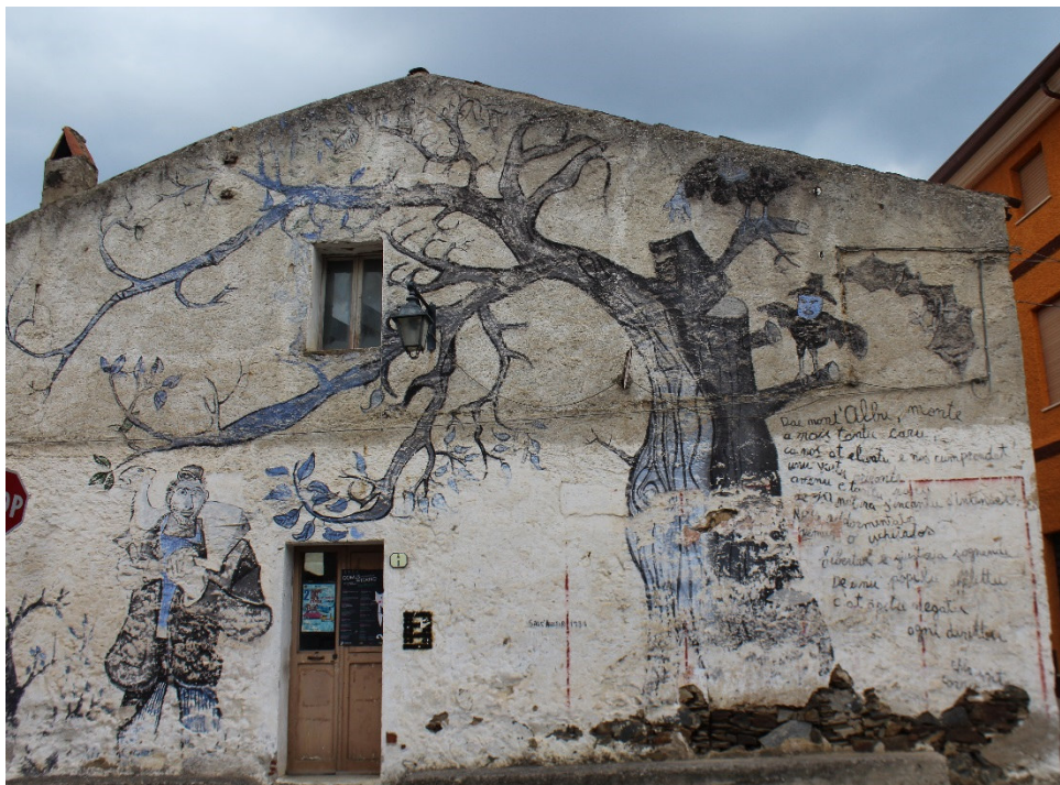
Figura 2 Vista Frontale