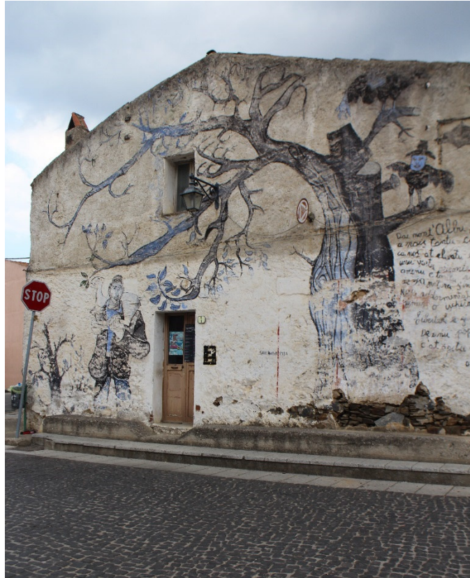
Figura 1 Vista frontale