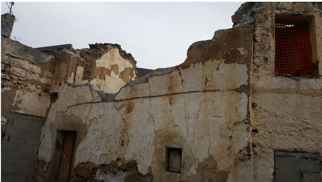
Figura 10 Vista Laterale