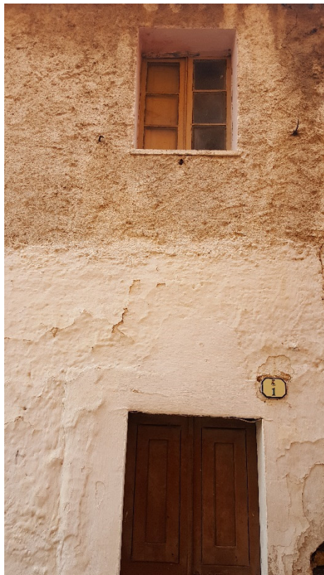
Figura 4 Vista Laterale