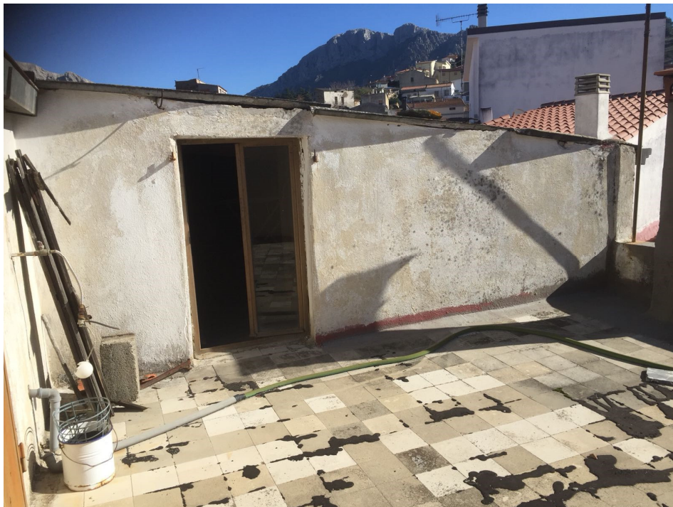
Figura 7 Vista Terrazza