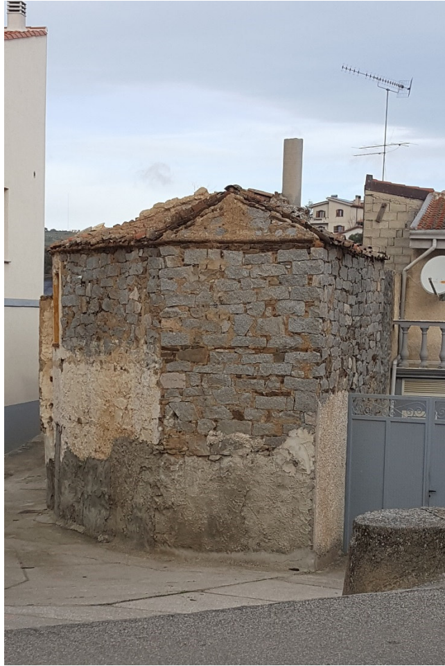
Figura 9 Vista Frontale