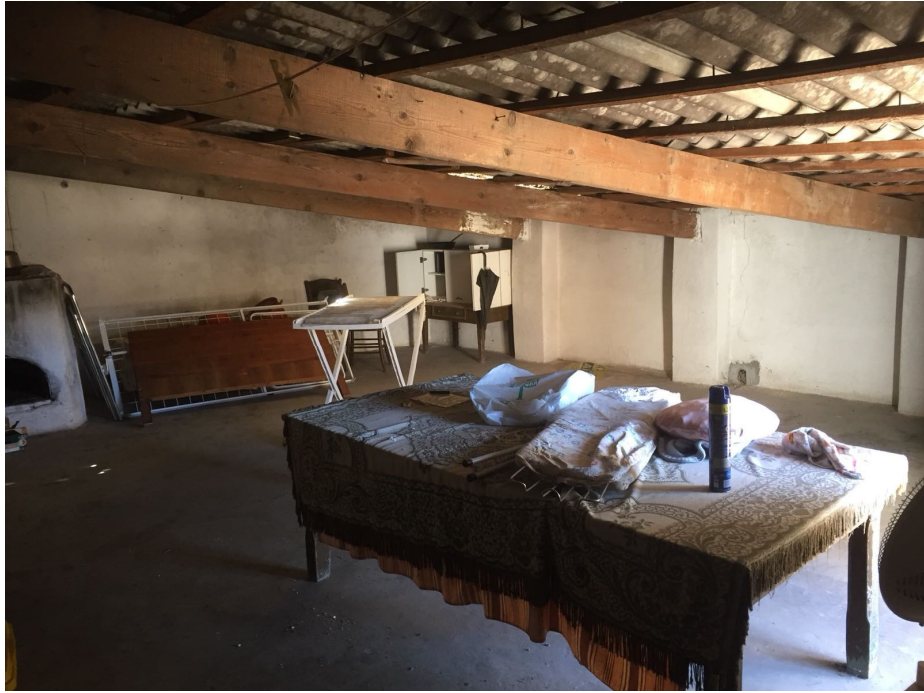
Figura 8 Vista Sottotetto