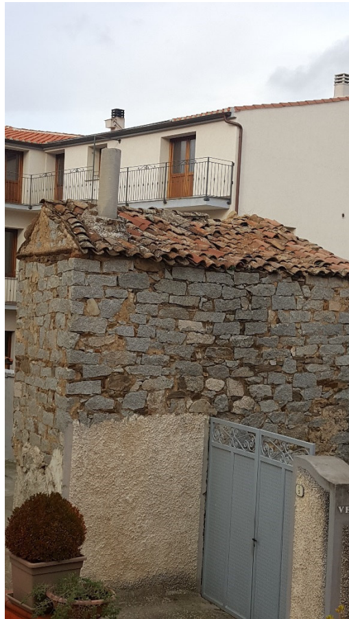
Figura 12 Vista Laterale