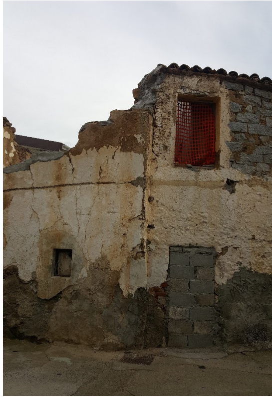
Figura 11 Vista Laterale