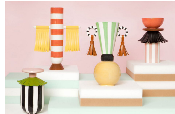
Collezione Masai