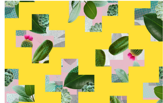
© Silvia Stella Osella, Adidas AvenueA 2016

DATE Jan 19th and 20th 2019 10:00-13.00 / 14:00-17:00