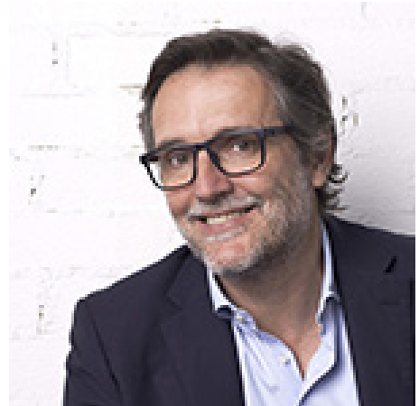
Urko Sanchez Urko Sanchez Archtiects Nairobi, Madrid