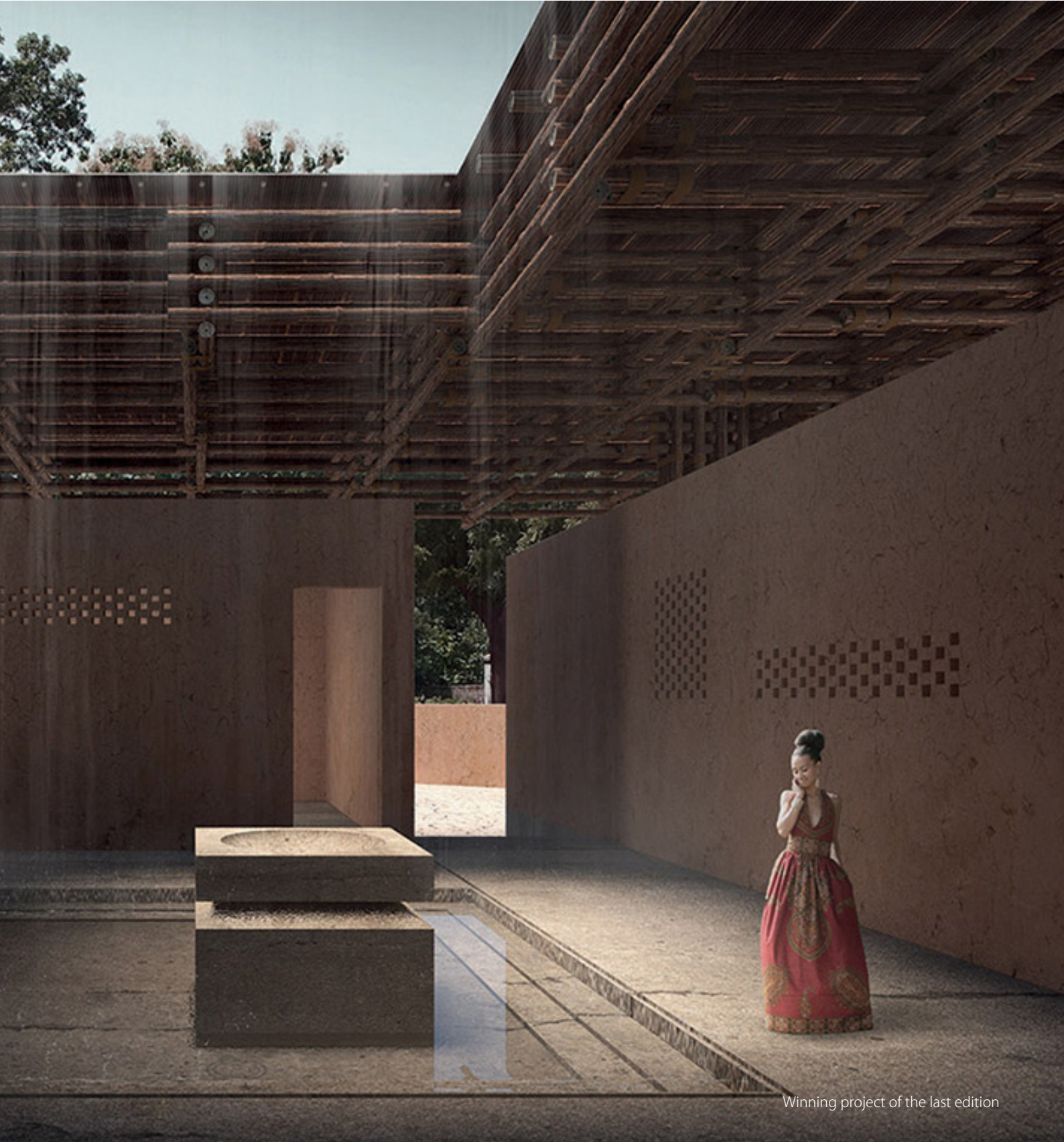
Winning project of the last edition