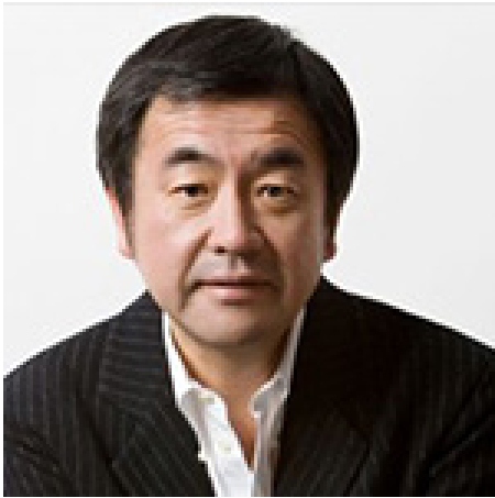
Kengo Kuma Kengo Kuma & Associates Tokyo, Paris, Beijing