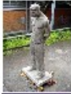
"Tappa" "Ponte di Isarco" vicino al Ponte di Tullio per il Ponte