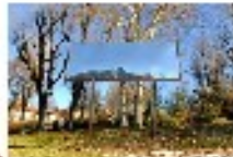
"Ponte" vicino al Ponte di Isarco