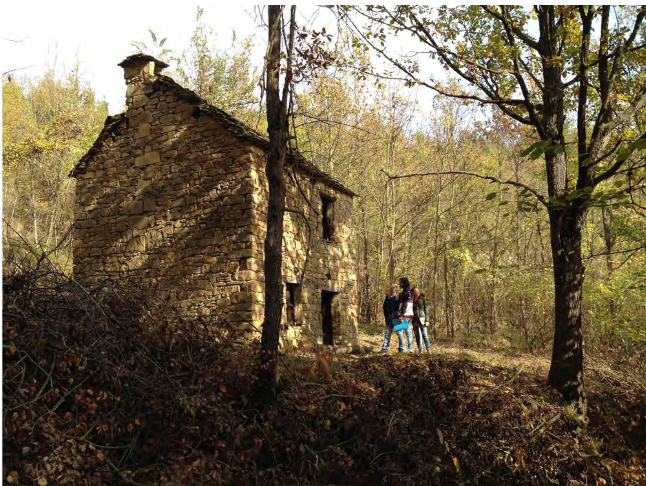
Un ciabòt dell'Alta Langa

I ciabòt sono piccole unità fondiarie, sparse in tutta l'Alta Langa, il cui impiego era legato alle attività dei campi. Sono costituiti di un'unica cellula funzionale abitualmente sviluppata su due piani. In Alta Langa la pietra, un'arenaria compatta e calcarea, viene usata sia per i terrazzamenti che per i tetti e i muri di tutti gli edifici, sia pubblici che religiosi, sia rustici che civili, con tecniche non dissimili. Nonostante la loro semplicità quindi, i ciabòt possono essere considerati l' unità minima delle costruzioni del territorio , da cui riprendono caratteri e tecnologie costruttive. Inoltre, la scala ridotta degli edifici consente nel ciclo dei laboratori annuali di affrontare le varie fasi del recupero.