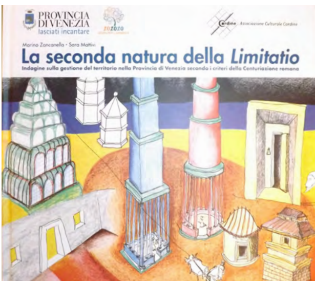
Il municipio di Borgorico, planivolumetrico; estratto dal volume "La seconda natura della limitatio" di Marino Zancanella e Sara Mattivi