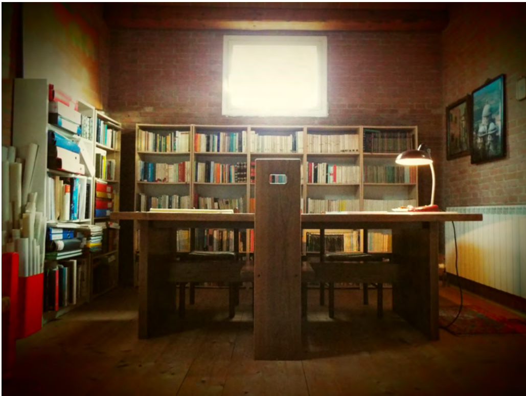
“La mia casa : residenza privata a Santa Maria di Sala” / Marino Zancanella ; da un’idea di progetto dell’architetto Aldo Rossi