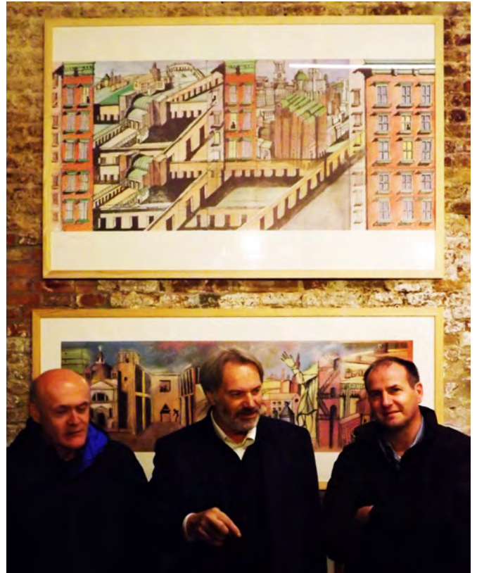
Collezione privata presso Laboratorium-Venezia