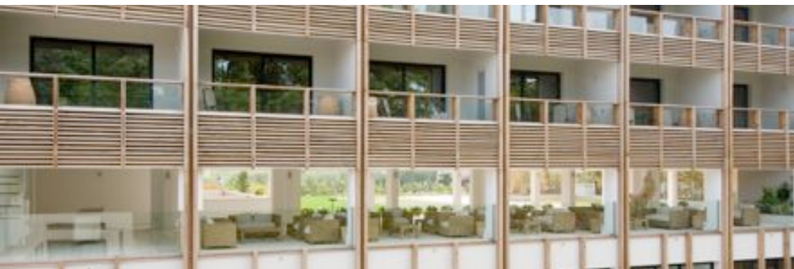
Progetto degli Architetti Ferruccio Franzoia e Claudio Silvestrin

In collaborazione con La Fondazione degli Architetti, P.P. e C. di VICENZA